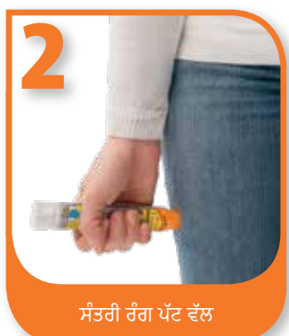
ਸੰਤਰੀ ਰੰਗ ਪੱਟ ਵੱਲ