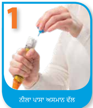
ਨੀਲਾ ਪਾਸਾ ਅਸਮਾਨ ਵੱਲ

EpiPen® ਅਤੇ EpiPen Jr® ਆਟੋ-ਇੰਜੈਕਟਰਜ਼ ਦੀ ਵਰਤੋਂ ਕਿਵੇਂ ਕਰਾਂ।